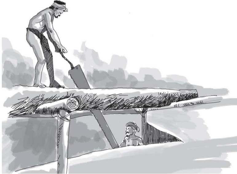
(සිතුවම- රාවය පුවත්පත)

දෙවන කුට්ටිය ලෙස හඳුන්වනු ලබයි. එසේ කපා ගනු ලැබූ කුට්ටි පලංචියක් මතට ගැනීම සිදු කරනු ලබයි. එය පහත ආකාරයට ඉදිරිපත් කළ හැකිය.